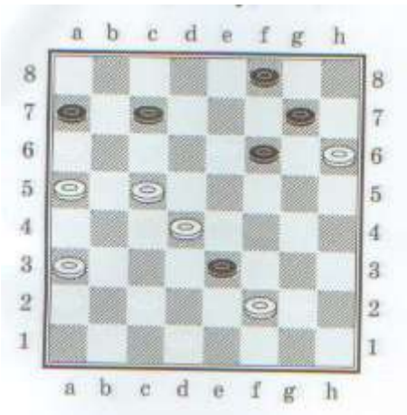
1. В. Чунчаев