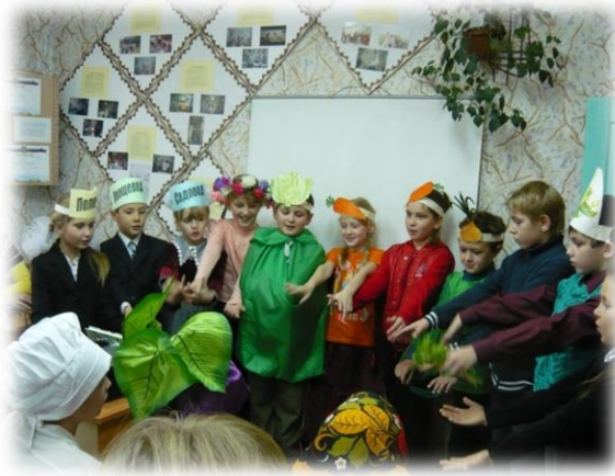
Рис. Городской праздник « Урожай»