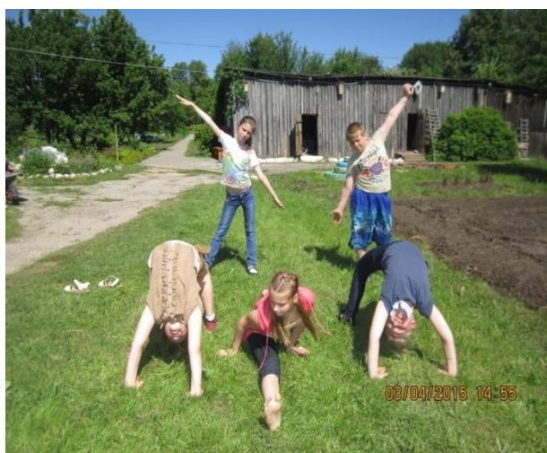
Рис. Лагерь «Юннат» готовится к конкурсу

Традиции, заложенные в далеком 1958 году продолжают. Дети с успехом трудятся на учебно-опытном участке, в питомнике, в теплице, ухаживают за животными живого уголка. Во время каникул на станции действуют лагеря дневного пребывания «Юннат» и лагерь труда и отдыха «Любители природы».