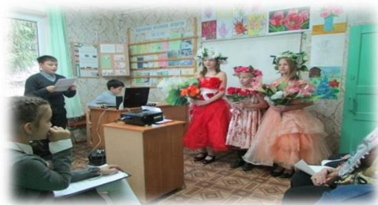
Рис. Праздник цветов

Теплица служит для ознакомления детей с биоразнообразием планеты, различными экосистемами, экологическими факторами роста и развития комнатных растений, а также для осуществления научно-исследовательской деятельности учащиеся по ботанике, экологии и цветоводству. Здесь занимаются дети по программам: «Цветоводство», «Ландшафтный дизайн», «Юный агроном», «Юный лесовод».