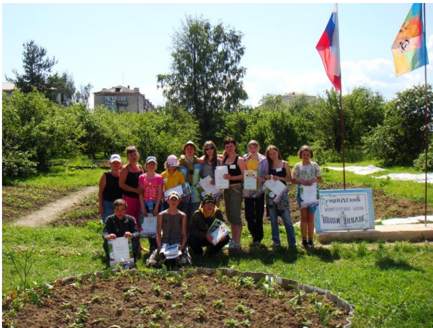
Рис.13 Городская экологическая школа

Походы, экскурсии, акции стали приоритетным направлением деятельности.