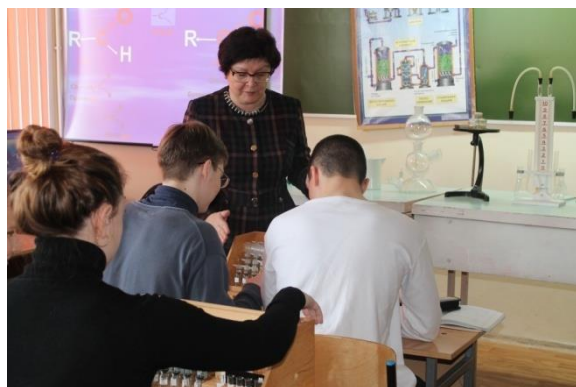
Рис. Занятие медицинского класса

С 2015 года нами заключен договор с Рязанским государственным медицинским университетом имени академика И.П. Павлова на оказание образовательных услуг по подготовке медицинского класса. То есть мы уже вышли на уровень профильного обучения. Из обучающихся медицинского класса с 2016 года сформирован волонтерский отряд « Медики», ребята оказывают помощь в медицинских учреждениях города.