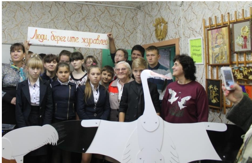
Рис. Гости из Окского заповедника на городском празднике «День птиц».

Осуществляется сотрудничество с союзом охраны птиц России, Окским биосферным заповедником, участвуют в работе международной рабочей группы по журавлям. (фенологические наблюдения)