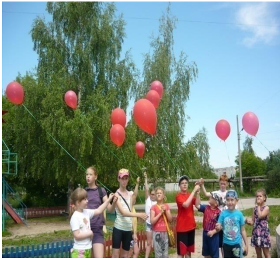
Рис. Лагерь «Юннат» участвует в акции

В настоящее время муниципальное бюджетное учреждение дополнительного образования «Станция юных натуралистов» муниципального образования – городской округ город Касимов организует работу с детьми и подростками города Касимова по естественнонаучной направленности. В мероприятиях станции ежегодно участвует около 5 тысяч детей. В самом учреждении в 53 учебных группах бесплатно занимается 707 детей, из них 3 детей с ограниченными возможностями здоровья. Станция юннатов в настоящее время является центром экологического образования города.