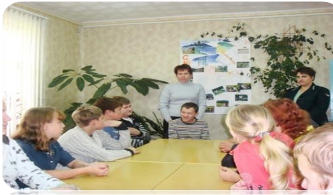
Рис. Занятие объединения «Юные лесоводы»