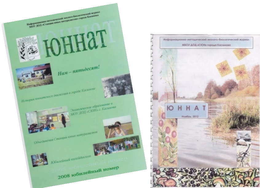
Рис. Журналы «Юннат»

В выставочном зале проводятся выставки детских творческих работ участников муниципальных этапов областных конкурсов: «Зеркало природы» и «Зелёная планета».