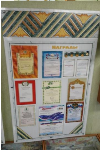
Рис. Экспонаты музея природы

Живой уголок является одним из объектов обзорной экскурсии по станции юннатов, знакомит посетителей с грызунами, птицами, рептилиями, млекопитающими и насекомыми разных географических зон. Здесь занимаются дети по программам « Живой уголок», «Юный орнитолог», осваивая азы обращения с дикими и домашними животными, особенности содержания животных в неволе.