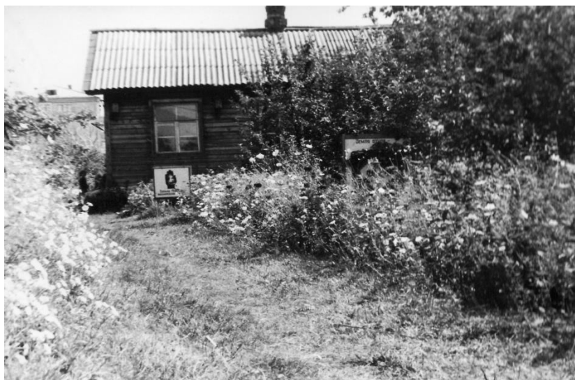
Рис. 1 Здание Станции юннатов

Началось движение юннатов с открытия Касимовской городской станции юннатов в 1958 году на базе запущенного сада бывшего колхоза « Огородник» по адресу: город Касимов, ул. Горького, д.30. На территории находилось одноэтажное деревянное здание с печным отоплением. Участок, отводимый юннатам составлял 3,5га. В то время эта территория находилась на окраине города.