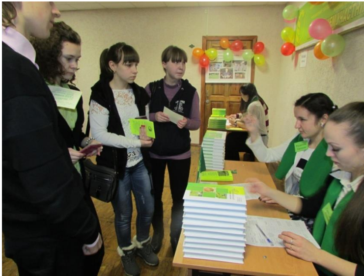
Рис. Учащиеся СЮН в агроуниверситете.

Преподаватели кафедры агроэкологического факультета являются научными консультантами воспитанников.