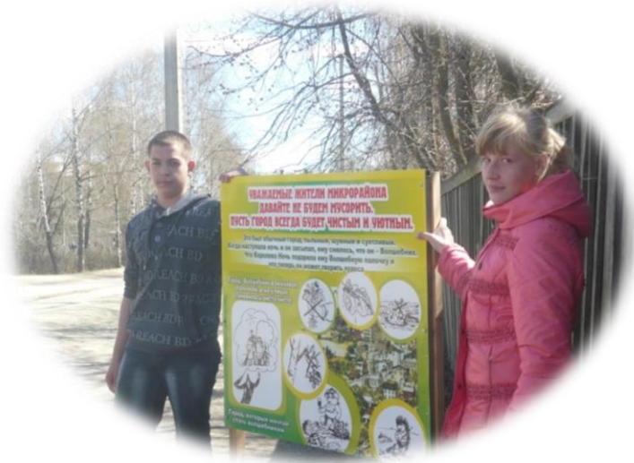
Рис. « Хранители природного наследия»

Для учащихся 10-11 классов работают объединения Основы генетики и селекции, Экологические основы химии ( медицинский класс).