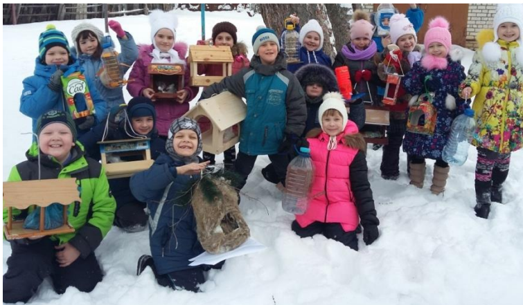
Рис. Акция « Столовая для пернатых»

В течение учебного года работает выставка методических разработок и пособий в помощь учителям общеобразовательных школ и учреждений дополнительного образования. Среди них сценарии юннатских праздников, разработки занятий для учебных групп, дополнительные общеобразовательные программы, подготовленные на базе методического кабинета МБУ ДО «СЮН»