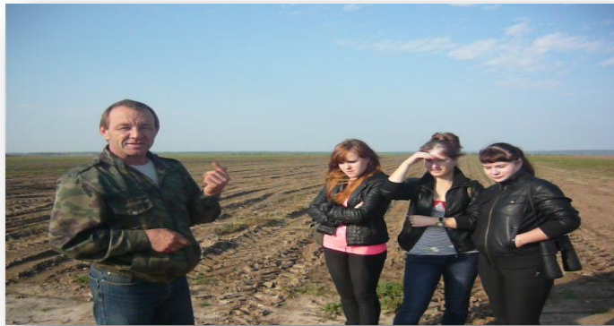
Рис. Юные агрономы на полях Касимовского района

Преподаватели кафедры агроэкологического факультета являются научными консультантами воспитанников.