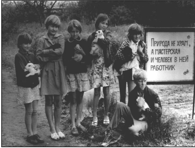
Рис.5 Юннаты с кроликами

Педагоги своей увлеченностью заряжали ребят и вместе с ними делали маленькие открытия. Мечтали и творили! В юннатском движении того времени существовала традиция трудового, производственного направления юннатских объединений. СЮН оказывала методическую помощь и проводила массовые мероприятия: слеты, смотры, конкурсы, праздники.