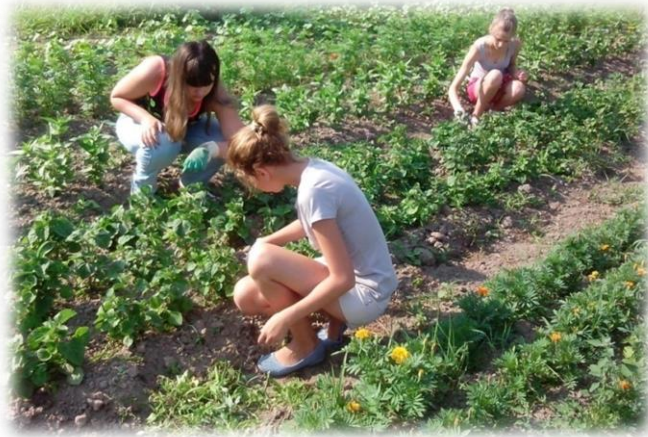
Рис. На учебно-опытном участке

-отдел лекарственных растений, где выращиваются лекарственные растения Рязанской области.