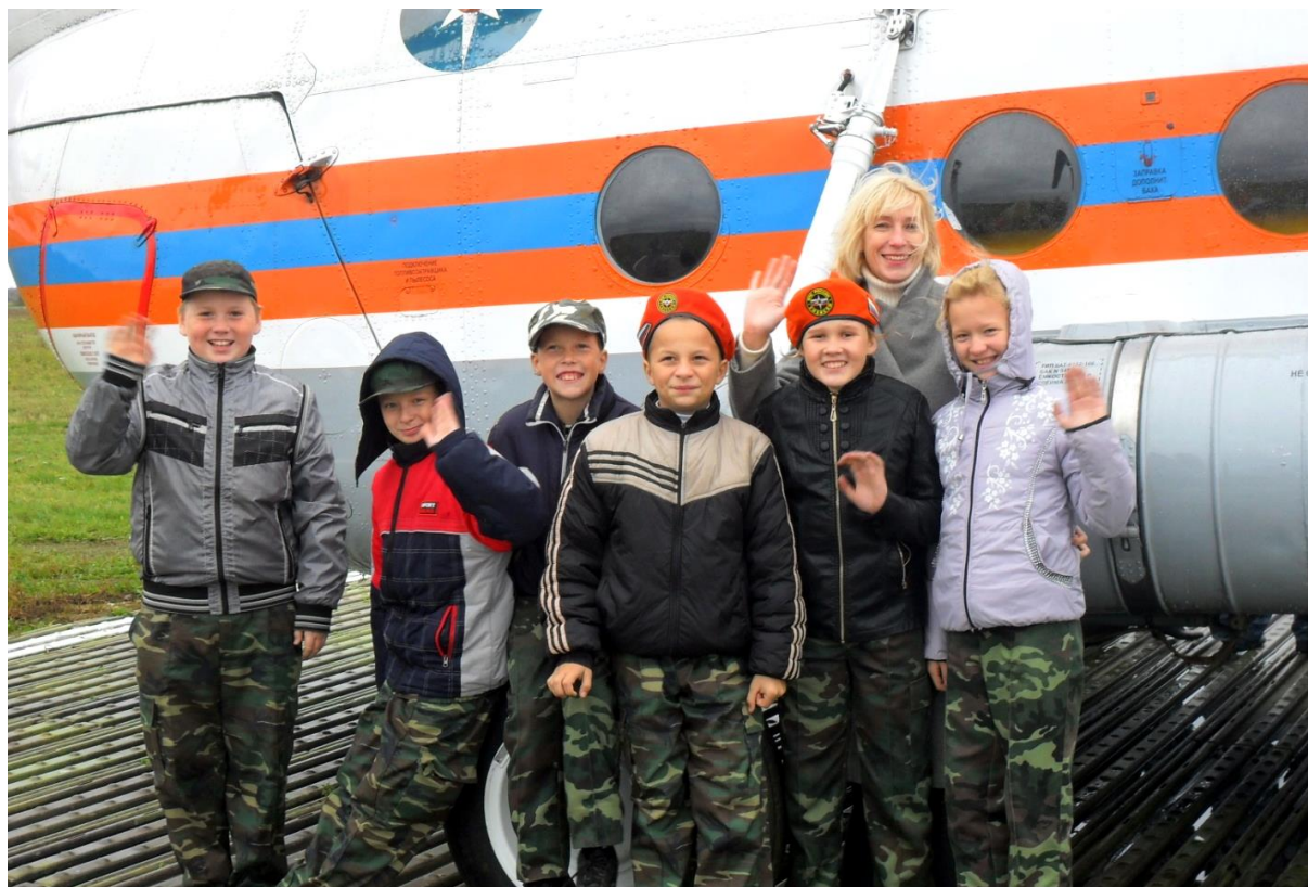
На Владимирской авиабазе