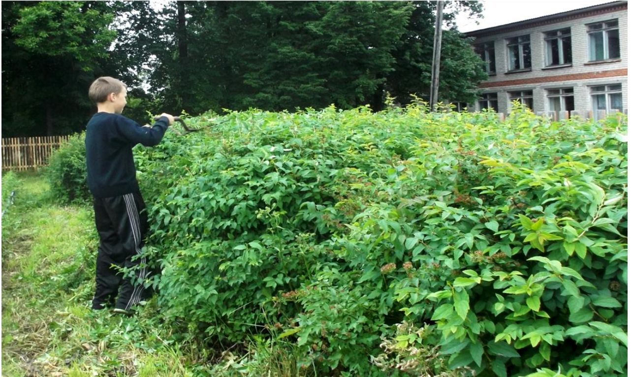
Стрижка декоративных кустарников