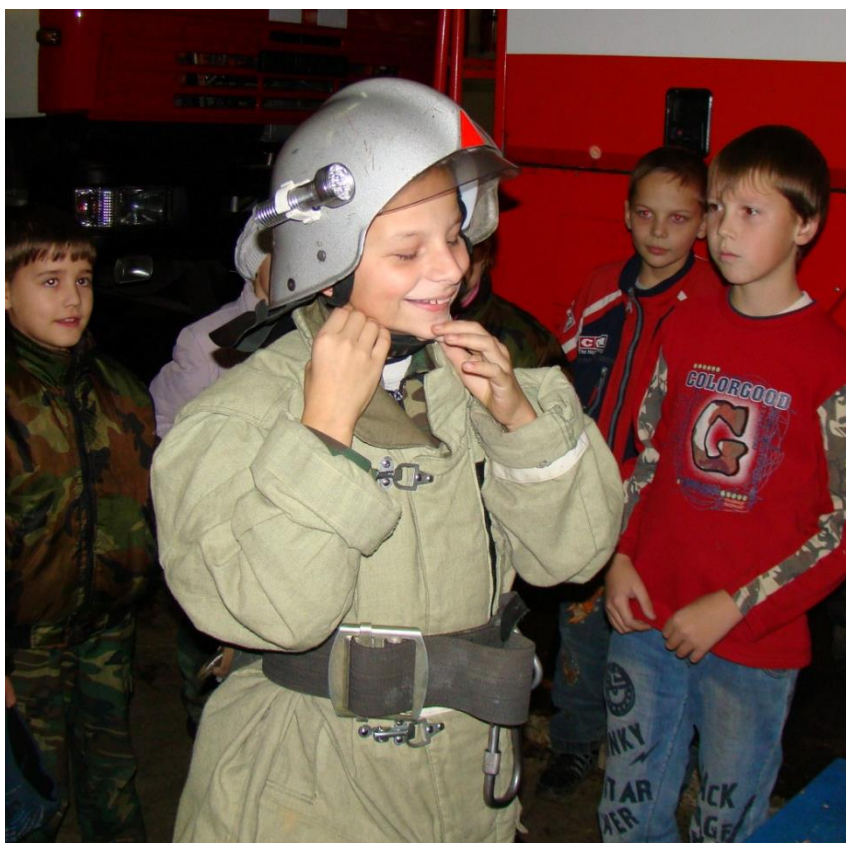
Профориентационные пробы на базе 11 ОФПС по Владимирской области