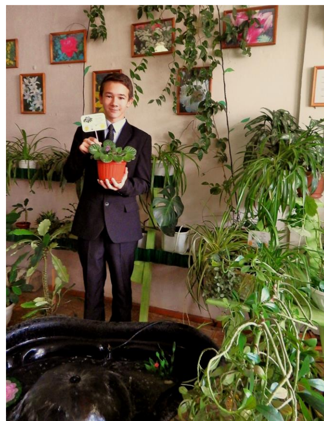
Занятие кружка «Юный цветовод»