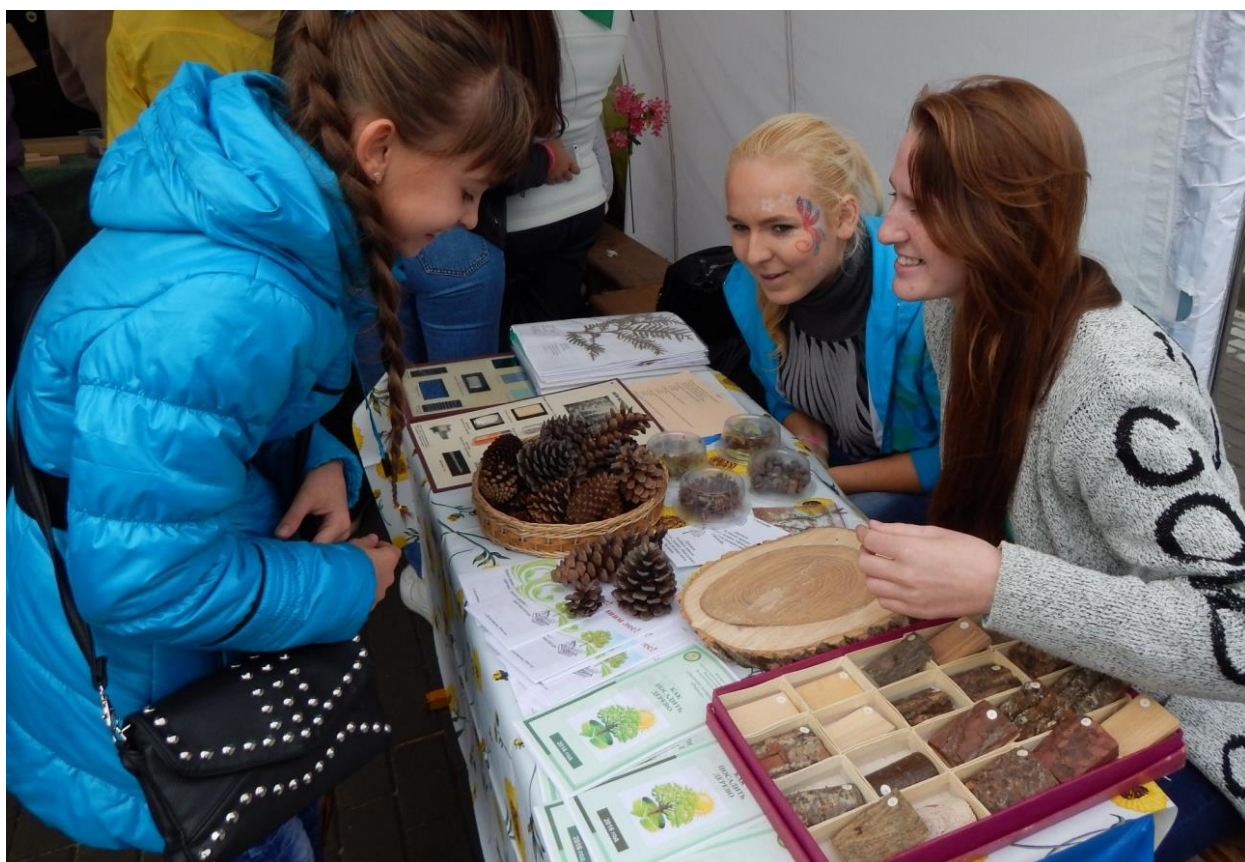
«ДоброСаммит». Мастер-класс «Древо жизни»