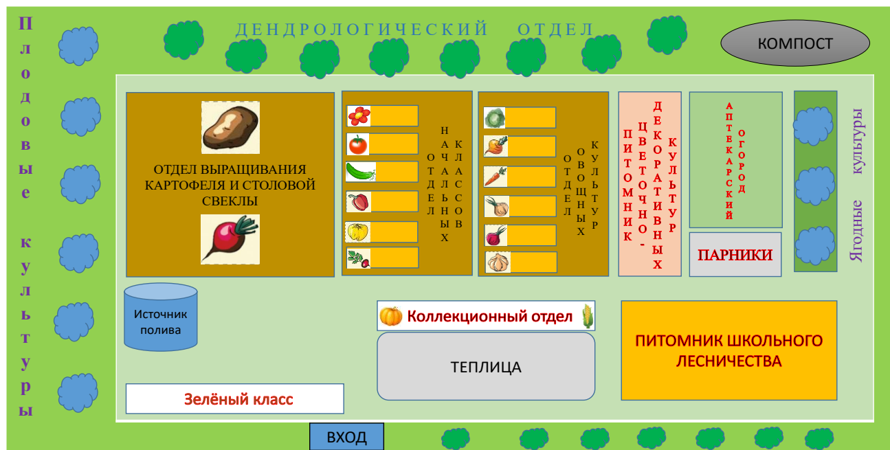
Схема школьного учебно-опытного участка