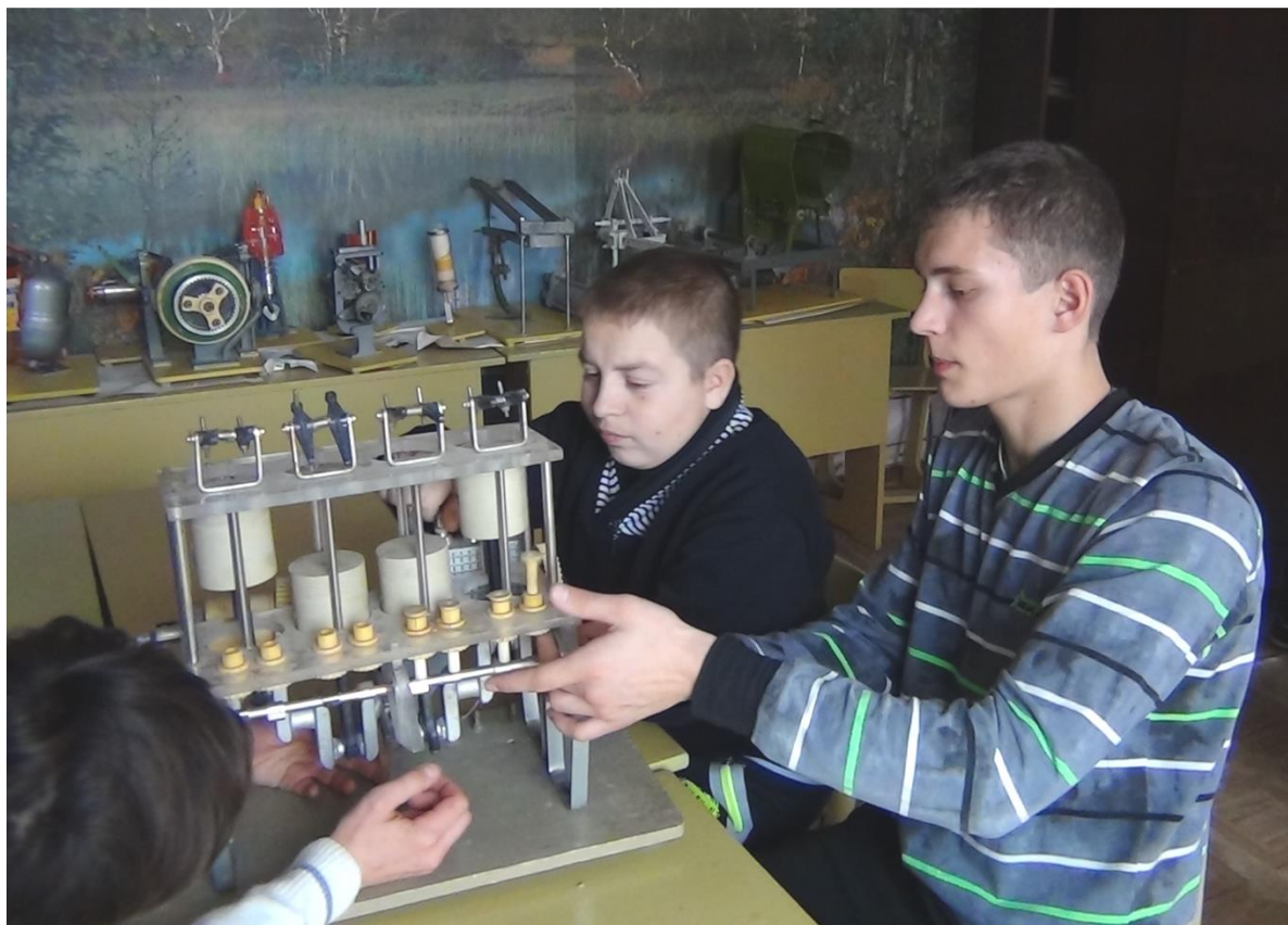
Занятия по курсу «Трактор»