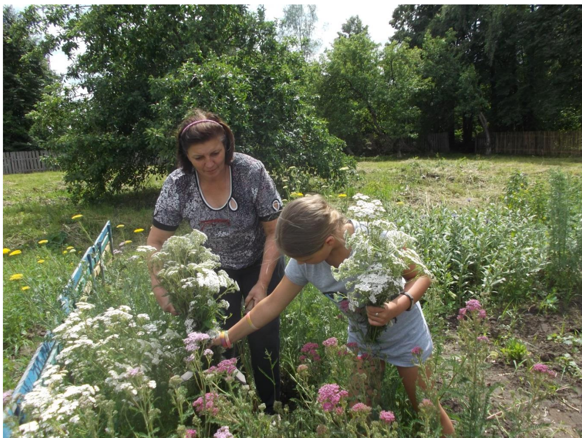
Отдел лекарственных трав (аптекарский огород)