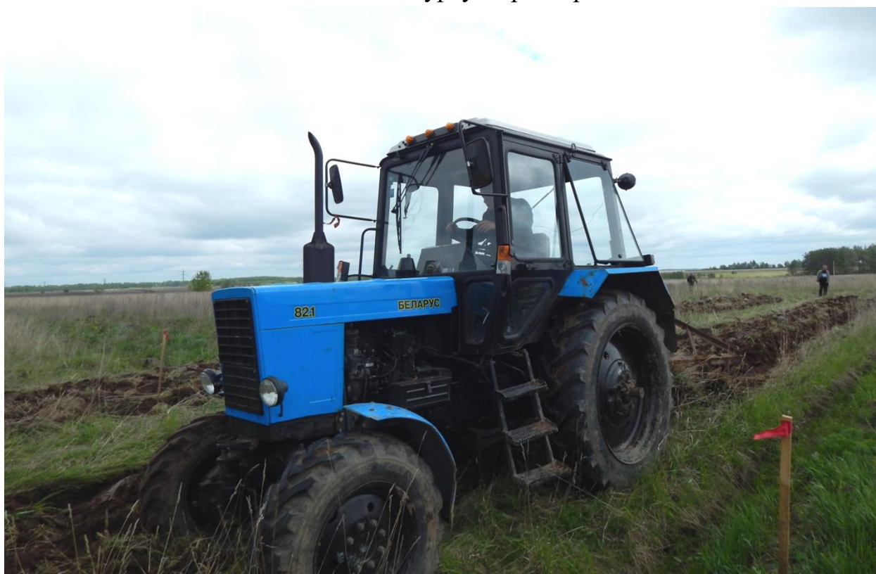
Конкурс юных трактористов «Первая борозда»