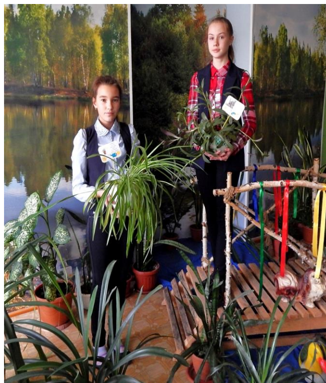
Оборудование «зимнего сада»