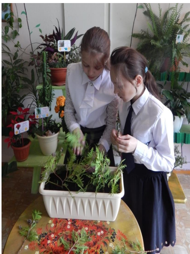
Занятие кружка «Школа юного лесника»